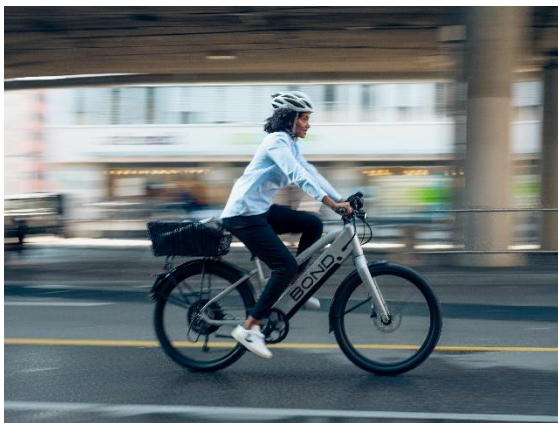
Bild 3: Mit einer Maximalgeschwindigkeit von 45km/h und einer Reichweite von bis zu 50km das optimale Fortbewegungsmittel in der Stadt Zürich.