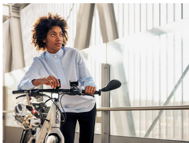
Bild 1: Pendeln mit dem E-Bike ist in der Stadt Zürich nun noch bequemer geworden.

Download in Originalgrösse: https://we.tl/t-ZAmsPTYmCk